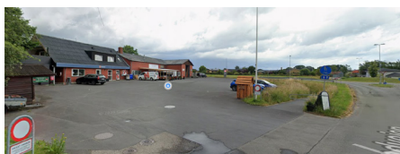
Eksisterende indkørsel til planområdet

Planområdet ligger i Fjellerup By ved rundkørslen i krydset mellem Strandvejen og Kastbjergvej. Området omfatter matr. nr. 15l og 4bo, Fjellerup By, Fjellerup. Mod nord afgrænses området af Kastbjergvej, mod øst af Strandvejen og mod vest af boligområdet ved Gartnerengen. Der er dobbeltrettet cykel- og gangsti langs den vestlige side af Strandvejen med tunnel under Kastbjergvej ved rundkørslen, som giver tryk forbindelse til sommerhusområderne og campingpladserne nord for Kastbjergvej.