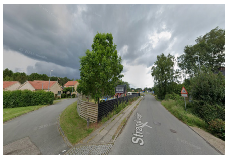
Planområdet set fra syd, hvor der i dag er et eksisterende énfamiliehus