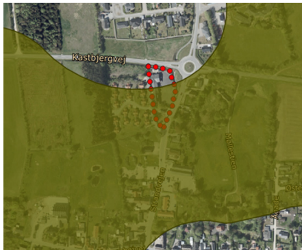
Areal inden for planområdet der indgår i Grønt Danmarkskort.

Der har været en forhåndsdialog med vejmyndigheden, der har oplyst, at vejmyndigheden efter ansøgning og efter sagsbehandling forventer at kunne godkende, at vejbyggelinjen forskydes ca. 5 m mod nord på den modsatte side af Kastbjergvej efter nærmere aftale mellem parterne. Det bemærkes her, at Norddjurs Kommune har adkomsten til arealerne på den modsatte side af Kastbjergvej”.