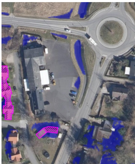
Kort, der viser oversvømmelsesområder ved ekstrem nedbør. www.klimatilpasning.dk

I forbindelse med klimaforandringerne vil der generelt være øget risiko for oversvømmelse. Oversvømmelser fra overfladevand sker primært i forbindelse med skybrudshændelser i sommerhalvåret samt ved oversvømmelser fra nærliggende vandløb i forbindelse med skybrud og stormhændelser. Som et resultat af den øgede mængde regn vil også grundvandet stige og til tider skabe oversvømmelser. Det er ejers eget ansvar at beskytte sin ejendom mod disse ekstremhændelser enten ved midlertidig beskyttelse eller permanente løsninger. Lokalplanområdet er enkelte steder påvirket af regnvand ved skybrud. En mindre del af lokalplanområdet, mod Strandvejen,