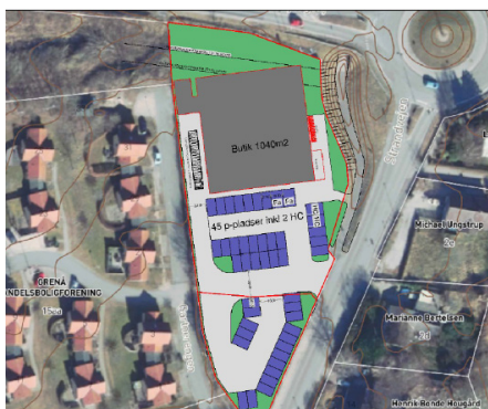
Situationsplan, der viser, hvordan projektområdet foreslås indrettet

Planområdet indgår i bymæssig sammenhæng langs Strandvejen med eksisterende detailhandel, service og boligområder. Udpegede sommerhusområder og turismefunktioner nord for Kastbjergvej skaber et kundegrundlag i højsæsonen.