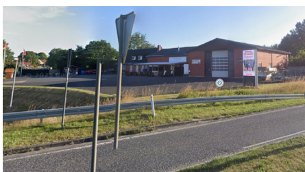
Området set fra Kastbjergvej

Lokalplanen er udarbejdet efter ønske fra en privat bygherre, der ønsker at opføre en dagligvarebutik med tilhørende parkeringsarealer og varelevering. Der kan eventuelt også blive tale om indpasning af andre anvendelser i mindre omfang i butiksbegyggelsen. Det kan være anvendelser inden for liberale erhverv og service som f.eks. et mindre spisested. Planen har til formål at styrke detailhandlen i Fjellerup og forbedre den lokale service for borgere og besøgende. Lokalplanen ledsages af et kommuneplantillæg, der udpeger området som en del af et lokalcenter og tilpasser rammerne, så etablering af dagligvarebutik kan muliggøres.